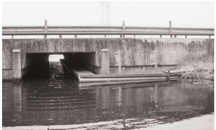
Een loopstrook onder de brug.

Het inktstempel bestaat uit een kunststof plaat met een standaardlengte van 52 cm. De breedte van de plaat (en het papier) is gelijk aan de breedte van de loopplank. Op de plaat ligt een met inkt verzadigd matje. Als inkt is een mengsel van paraffineolie en koolstofpoeder gebruikt. Omdat olie nauwelijks verdampt is het niet nodig om tus-