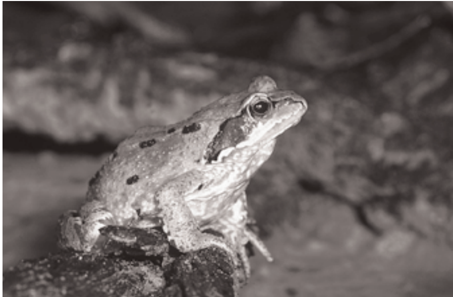
Kleine watersalamander, bruine kikker en gewone pad maken het meest gebruik van de voorzieningen.

ten noorden van de grote rivieren - betrekking hebben op kleine watersalamander. Sporen van een salamander op een loopstrook in de kop van Noord-Holland zullen vrijwel zeker afkomstig zijn van een kleine watersalamander, aangezien andere soorten salamanders ten noorden van het Noordzeekanaal niet voorkomen.