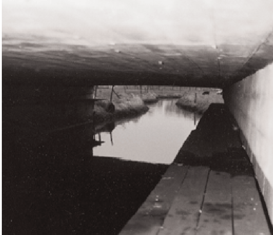
Een loopplank met houten substraat.

Amfibieën worden in beleidsplannen ten behoeve van ontsnippering regelmatig genoemd als doelsoorten voor doorgetrokken oevers, ecoduikers en vanzelfsprekend amfibieëntunnels (Smit, 1996). Loopplanken, drijvende vlonders en dergelijke worden vooral aangelegd voor zoogdieren als wezel, hermelijn en bunzing. Bij de aanleg van dergelijke constructies wordt niet uitgegaan van gebruik door amfibieën (Smit, 1996). De huidige studies laten echter zien dat dit type faunapassages door amfibieën goed gebruikt wordt: tot 46% van het gebruik komt op naam van amfibieën. Het gebruik van veel loopplanken is hierdoor vergelijkbaar met dat van zoogdieren.