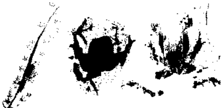
Figuur 1. Voorbeelden van inktprenten van salamander, pad en kikker verkregen met de inktmethode op loopplanken (Brandjes & Veenbaas, 1998; Brandjes, 1999).

De inktmethode levert fraaie en duidelijke prenten van amfibieën op (figuur 1). Hoewel prenten van alle drie de soortengroepen ook in zilverzand herkenbaar zijn, ontbreken hier de fijnere details zoals de verdikte uiteinden van de teentjes. Inktsporen van amfibieën zijn doorgaans niet op soort te determineren. Determinatie op het niveau van de drie soortengroepen salamanders, padden en kikkers is vaak wél mogelijk. Dit geldt zowel voor de inktmethode als voor de zandbedden.